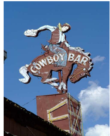
Ville de FLAGSTAFF