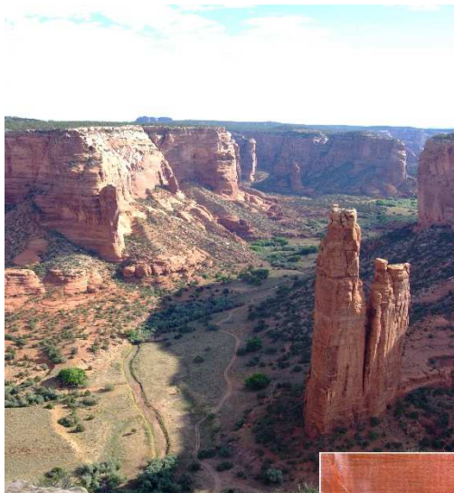
Canyon de CHELLY

L'Ouest américain ce sont aussi des villes étonnantes : Salt Lake City, capitale des Mormons ; Las Vegas, ville des jeux ; Jackson, ville des Cow-boys ; Flagstaff, ville des pionniers.