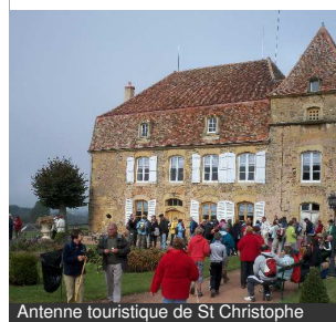
Antenne touristique de St Christophe