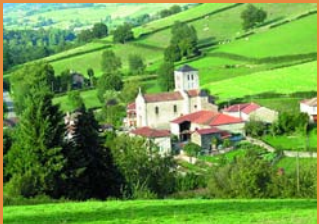
Vue sur l'église.