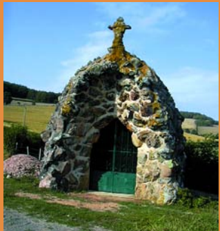
La grotte

reprises par des passerelles pittoresques, serpente dans la vallée, laissant deviner la présence de truites sauvages très prisées des pêcheurs.