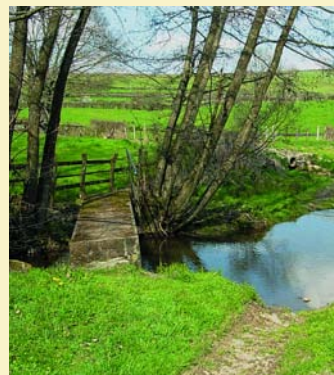
Passerelle sur la Grosne

7 Dans le hameau, prendre à droite pour descendre jusqu'à Saint-Pierre-le-Vieux, face au clocher. Traverser le village et retrouver le départ.