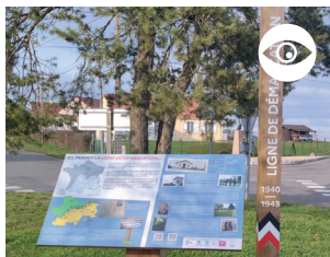
PUPITRE SOUVENIR DE LA LIGNE DE DÉMARCATIION