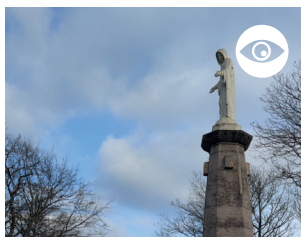
NOTRE-DAME DE LA GARDE