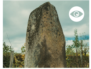
MENHIR DES CAILLOTS