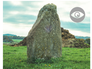
PIERRE DE CHAMPITOUX

Ancienne borne de la seigneurie de Brandon.