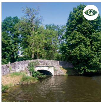
PONT PARIZENOT (HORS CIRCUIT)

Le Pont Parizenot a été dessiné par Emiland Gauthey (architecte du canal du Centre). C'est le seul pont existant lié à la conception d'origine du canal.