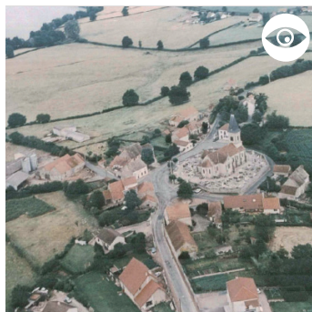
LE BOURG VU D'AVION ET SON CIMETIÈRE EN CIRCULADE