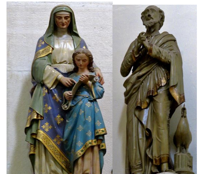
Statue de Sainte Anne éduquant Marie et de Saint Pierre (avec le coq) après son reniement