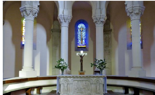
Maître-autel néo-gothique et déambulatoire

arcades en plein cintre du sanctuaire retombent sur des colonnes rondes surmontées de chapiteaux à crochets.