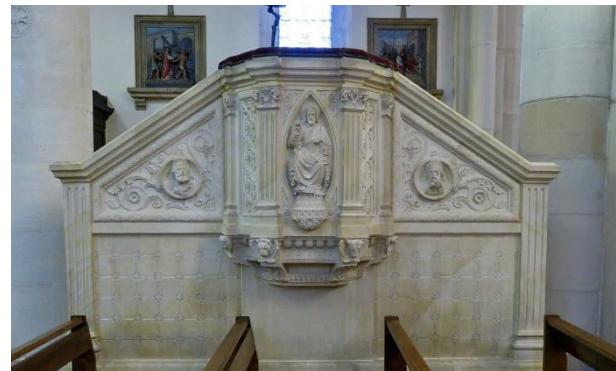
Chaire à prêcher néo-gothique avec Christ enseignant

Le fond de chaque croisillon est décoré de trois grands tableaux : - au nord : le Baptême du Christ ; - au sud : la Vierge en Gloire avec deux saints agenouillés dont un dominicain ; un saint ermite ; la Sainte Famille. Dans le croisillon nord est apposée une plaque des noms des principaux bienfaiteurs de la paroisse, à gauche de l'autel néo-gothique de la Vierge présentant son Fils au monde. Le devant d'autel représente une Annonciation.