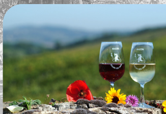
Frontière discrète entre les terroirs viticoles du Mâconnais et ceux du Beaujolais, les préférences oscillent entre rouge et blanc.

Rendez-vous au Bois de Fée pour une promenade où vous retrouverez un point de vue magnifique sur les monts du Beaujolais. Profitez de la fraîcheur des sous-bois avant de goûter au plein soleil des pelouses calcaires qui coiffent le point culminant de votre randonnée.