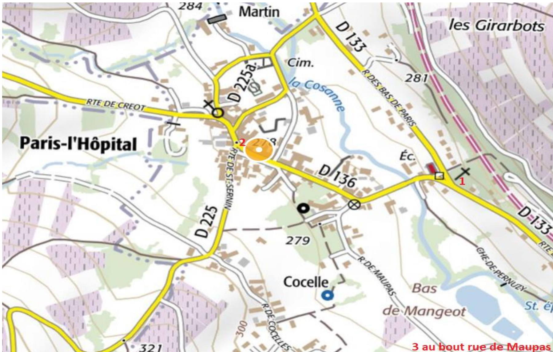
Circuit des croix de Paris-l'Hôpital n°1-2-3 en rouge