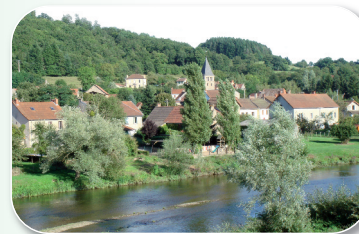
Village de Charbonnat

Charbonnat est traversé par l'Arroux. Le pont qui enjambe la rivière fut bâti pour remplacer un bac qui permettait la traversée de l'Arroux. Ce pont détruit pendant la Seconde Guerre mondiale, fut rebâti peu de temps après la fin de celle-ci.