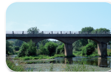
Pont sur l'Arroux