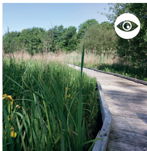
MARAIS DU PONT DES MORANDS