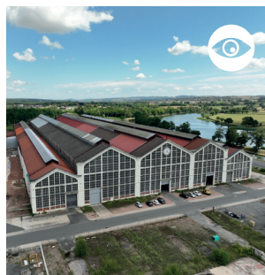
FONDERIE HENRI-PAUL Nommée ainsi en mémoire du fils d'Eugène II Schneider