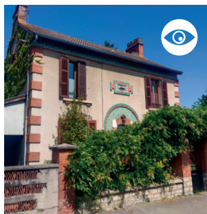
MAISONS CÉRAMIQUES du quartier de la gare