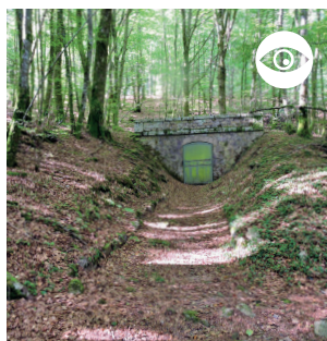
POINT DE DÉPART DU TUNNEL DE CAPTAGE DES EAUX DU RANÇON POUR L'ACHEMINEMENT AU CREUSOT