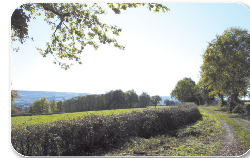
Aire de pique-nique du bois des chaumes