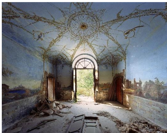
PAPPAGALLO, Italie, 2018

Le Centre des monuments nationaux présente l'exposition du photographe Thomas Jorion « Veduta », qui se tiendra du 22 octobre 2020 au 28 février 2021, au farinier de l'abbaye de Cluny.