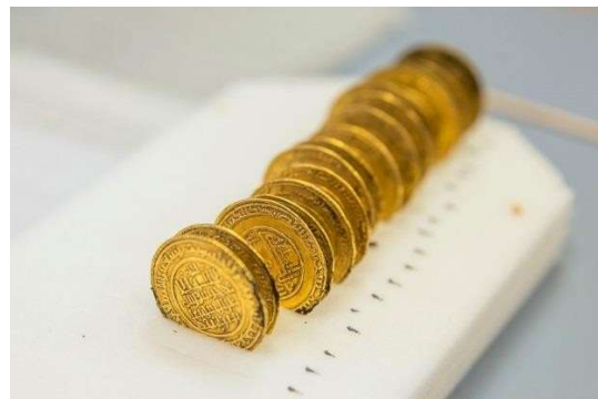
© Alexis Grattier – Université Lumière Lyon 2

L'Université Lumière Lyon 2, le CNRS, l'Association des Amis du Musée d'Art et d'Archéologie (AMAAC), le Centre des monuments nationaux, la Ville de Cluny et la Direction Régionale des Affaires Culturelles (DRAC) de Bourgogne Franche-Comté s'associent pour présenter une nouvelle fois ce trésor au public.