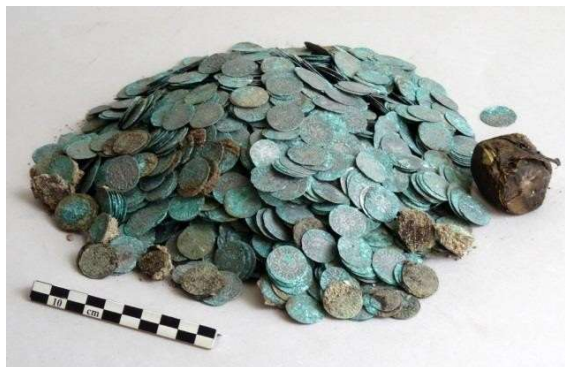
© Vincent Borrel – ENS / Laboratoire Archéologie et Philologie d'Orient et d'Occident – Avant restauration

En septembre 2017, les fouilles archéologiques menées dans les jardins de l'abbaye de Cluny par l'Université Lyon 2 – CNRS UMR 5138 ont révélé un incroyable trésor monétaire : près de 2200 deniers et oboles clunisiens en argent. C'est la première fois qu'un tel trésor monétaire, réuni dans un ensemble clos, est retrouvé. Cette découverte majeure fait actuellement l'objet de nombreuses recherches (notamment dans le domaine de la numismatique), ainsi que de restaurations importantes, pour redonner à l'ensemble tout son éclat.