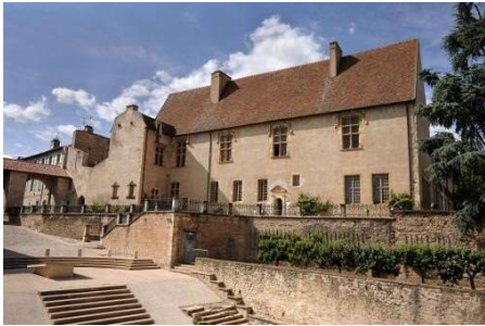
Palais Jean de Bourbon

Le musée d'Art et d'Archéologie de Cluny est abrité dans l'ancien palais abbatial de Jean de Bourbon (abbé de Cluny de 1466 à 1485) édifié dans l'enclos de l'abbaye durant la seconde moitié du XV e siècle (classé parmi les Monuments Historiques). Le musée est créé en 1864, à la mort du docteur Jean-Baptiste Ochier, dont la veuve donne à la ville de Cluny le palais et l'importante collection d'objets d'art et d'éléments lapidaires que le docteur y avait réunie. Des dons, des fouilles archéologiques (notamment celles de K.J. Conant de 1928 à 1950) et des achats enrichissent depuis un fonds aujourd'hui constitué de plusieurs dizaines de milliers de pièces. Objets archéologiques, sculptures médiévales, peintures anciennes,