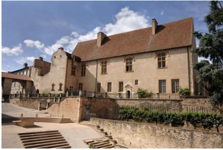
Palais Jean de Bourbon

Le musée d'Art et d'Archéologie de Cluny est abrité dans l'ancien palais abbatial de Jean de Bourbon (abbé de Cluny de 1466 à 1485) édifié dans l'enclos de l'abbaye durant la seconde moitié du XV e siècle (classé parmi les Monuments Historiques). Le musée est créé en 1864, à la mort du docteur Jean-Baptiste Ochier, dont la veuve donne à la ville de Cluny le palais et l'importante collection d'objets d'art et d'éléments lapidaires que le docteur y avait réunie. Des dons, des fouilles archéologiques (notamment celles de K.J. Conant de 1928 à 1950) et des achats enrichissent depuis un fonds aujourd'hui constitué de plusieurs dizaines de milliers de pièces. Objets archéologiques, sculptures médiévales, peintures anciennes,