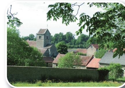
Vue sur Saint Gervais sur Couches

Saint Gervais sur Couches, son église romane et sa vue sur le mont Rème.