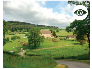
FERME DE LA ROCHE