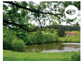
ÉTANG DU CHAMP TROIS