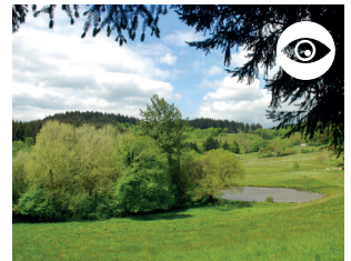
ÉTANG DE MOIRANS MERLE