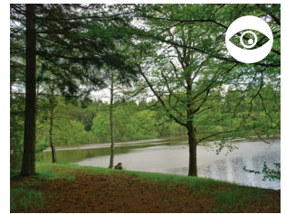
ÉTANG DU PRIEURÉ