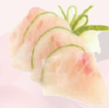
Sashimi Daurade 8,80 €