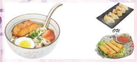
M9 : Soupe Udon Saumon 17.80€

1 Salade de choux 4 Nems fruits de mer ou 5 raviolis Nouilles japonaises servies avec un bouillon miso, des tempuras de crevettes, des algues de nori, des tranches de narutomaki et des légumes.