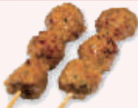
Yakitori boulettes poulet 4,30 €