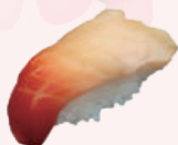
Sushi palourde 5,50 €