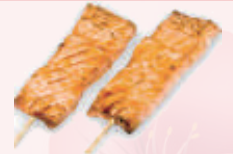
Yakitori saumon 4,80 €