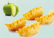
Raviolis aux pommes (4 pieces) 5,00 €