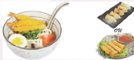
M8 : Soupe Udon Tempura Crevette 17.80€

1 Salade de choux 4 Nems fruits de mer ou 5 raviolis Nouilles japonaises servies avec un bouillon miso, du bœuf parfumé, des algues de nori, des tranches de naruto maki et des légumes.