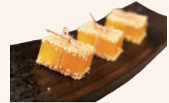
Nougat chinois 3,00€