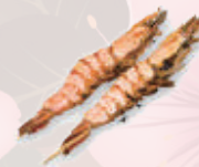
Yakitori crevette black tiger 6,00 €