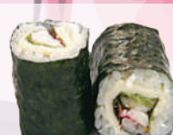
Maki avocat crevette 5,00 €