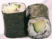
Maki concombre 4,00 €