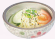
Salade de chou 2,50 €