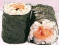
Maki saumon 4,50 €

Garniture entourée de riz vinaigré et d'une feuille d'algue nori. (Vendu par 6 pièces)