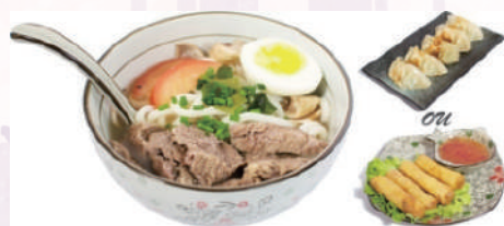
M7: Soupe Udon Bœuf 16,80 €

1 Soupe miso 1 Salade de choux 4 Nems fruits de mer ou 5 raviolis Nouilles japonaises sautées avec des crevettes géantes et des légumes de saison.