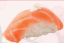
Sushi saumon fromage 5,00 €