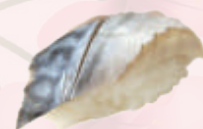
Sushi maquereau 5,00 €