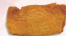
Sushi tofu frit 4,50 €