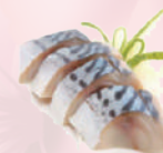
Sashimi Maquereau 8,80 €