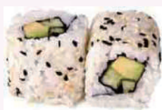
California roll concombre avocat 5,30 €