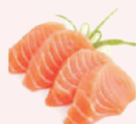
Sashimi Saumon 9,80 €

Tranche de poisson cru (vendu par 8 pièces)