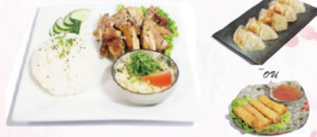
M2 : Don au Poulet 16,50 €

1 Soupe miso 1 Salade de choux 5 Raviolis Poulet frit façon japonaise accompagné de riz.