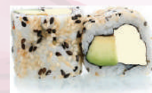
California roll avocat fromage 5,30 €