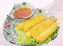
Tempura crevette (5 pieces) 8,50 €