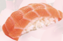
Sushi saumon 4,50 €

Boule de riz vinaigré recouverte d'une tranche de garniture, (vendu par paires)