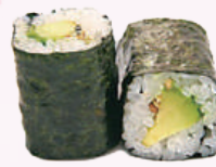
Maki avocat 4,00 €