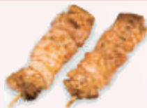
Yakitori poulet 4,30 €