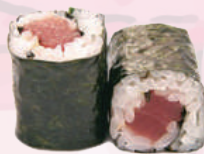
Maki thon 5,00 €