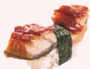
Sushi anguille grillée 6,00 €