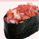
Gunkan crabe 5,50 €