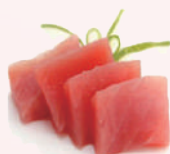
Sashimi Thon 11,80 €