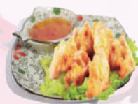
Poulet kara age (6 pieces) 6,50 €