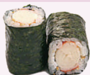
Maki surimi 4,50 €