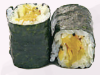
Maki navet jaune 4,00 €