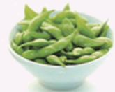
Edamame 4,00 €