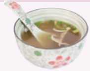
Soupe miso 2,50 €