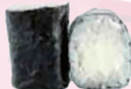
Maki fromage 4,50 €