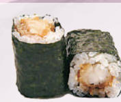
Maki crabe 4,50 €