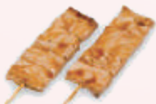
Yakitori thon 5,00 €