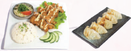
M1 : Poulet Torikatsu 16,50 €

1 Soupe miso 1 Salade de choux 5 Raviolis Poulet frit façon japonaise accompagné de riz.