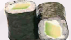
Maki avocat fromage 4,50 €