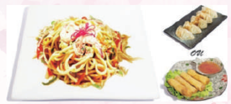
M6 : Sauté Udon Crevettes 17,80 €

1 Soupe miso 1 Salade de choux 4 Nems fruits de mer ou 5 raviolis Saumon grillé façon japonaise accompagné de riz.