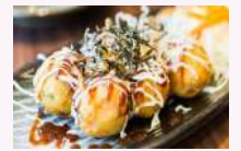
Takoyakis (4 pieces) 6,50 €