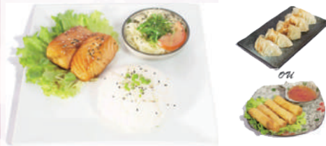
M5 : Don au Saumon 18,80 €

1 Soupe miso 1 Salade de choux 4 Nems fruits de mer ou 5 raviolis Nouilles japonaises sautées avec du bœuf parfumé aux cinq épices et des légumes de saison.