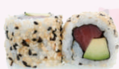
California roll thon avocat 5,50 €