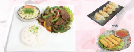
M3 : Don au Bœuf 17,50 €

1 Soupe miso 1 Salade de choux 4 Nems fruits de mer ou 5 raviolis Poulet grillé façon japonaise accompagné de riz.