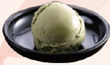
Glaces japonaises (par boule)