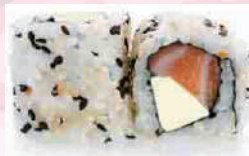
California roll saumon fromage 5,50 €