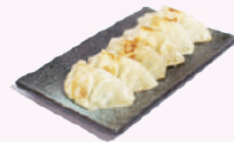
Raviolis japonais (6 pieces) 6,50 €