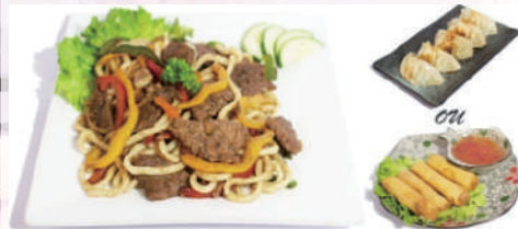
M4 : Sauté Udon Bœuf 17,50 €

1 Soupe miso 1 Salade de choux 4 Nems fruits de mer ou 5 raviolis Bœuf parfumé aux cinq épices accompagné de riz et de légumes de saison.