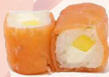
California roll mangue fromage 5,00 €