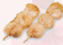
Yakitori saint jacques 5,80 €