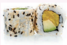
California roll radis avocat 5,30 €