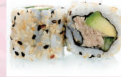
California roll thon cuit avocat 5,50 €