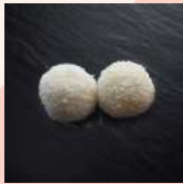
Perles coco (vendu par paire) 3,50€