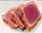
Tataki Thon (mi cuit) 12,80€