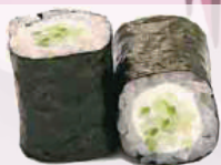
Maki concombre fromage 4,50 €