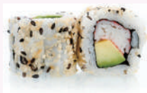
California roll surimi avocat 5,50 €