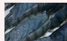
Sushi obsiblué 6,50 €