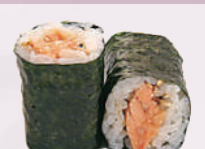
Maki thon cuit 4,50 €