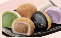
Mochi (Vendu par 3 parfum au choix) 5,00€