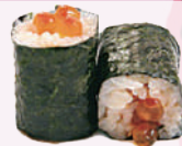
Maki œufs de saumon 6,00 €