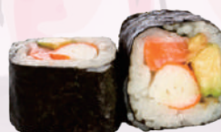
Futomaki (riz vinaigré, algue japonaise, avocat, saumon cru, surimi, navet mariné, mayonnaise japonaise) 10,80 €