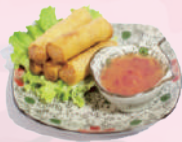
Tempura Nems fruits de mer (5 pieces) 6,50 €