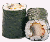
Maki anguille 5,50 €