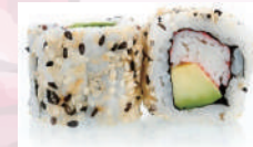
California roll crabe avocat 5,50 €