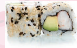
California roll crevette avocat 5,50 €