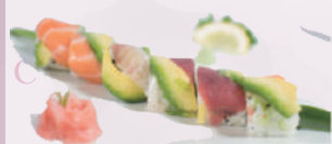
Roll Arc-En-Ciel (saumon, thon, daurade, avocat, surimi) 9,80 €