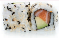
California roll saumon avocat 5,50 €

Garniture enrobée d'une algue et de riz vinaigré. (Vendu par 6 pièces)