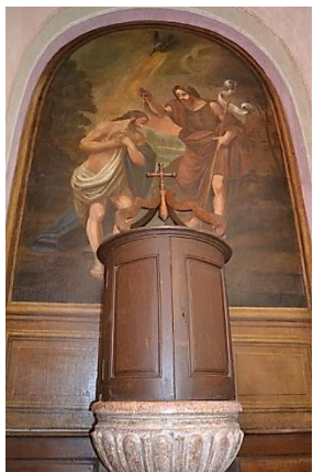
Fonts baptismaux : vasque de calcaire rose du XVIIIe siècle, inscrite aux MH en 1998. Tableau du Baptême du Christ par Jean-Baptiste .

L'intérieur a retrouvé son aspect d'origine et de nombreux objets ont été inscrits aux MH en 1998 (grille de l'autel en fer forgé (1803), Credo sous-titré, unique en son genre en France, boiseries de la nef) et classés MH en 1992 (tableaux XVIIIe de St Laurent et de la Vierge à l'Enfant).