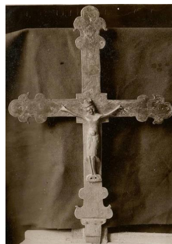
Bénitier au chapiteau roman / Croix processionnelle du XIII e siècle classée du Christ en Gloire couronné