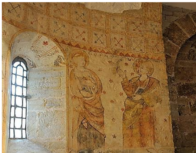
Peinture murale des apôtres saint Thomas et saint Luc et décor de damier garni de croix de Saint-André tréflées, rouges et noires en alternance

apôtres du cortège apostolique sur un décor de quintefeuilles rouges.