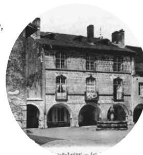
La place Puvis de Chavannes

Cuiseaux, ancienne cité médiévale, est inscrite à l'inventaire des sites pittoresques de Saône-et- Loire.