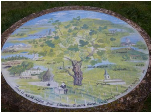
Table originale, de forme ronde qui nous donne une vue à 180° à une altitude d'environ 300 m. on trouve sur le site de nombreux panneaux d'explications sur la faune, la flore, les cépages et les cadoles. Au-delà vue sur le Mâconnais, la Bresse et les Alpes.