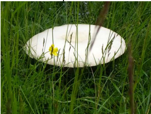
Rosé des prés