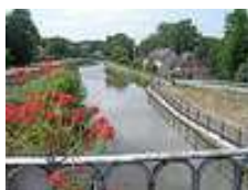
Canal du centre