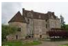
Château de Chamilly

Le Canal du centre, le centre thermal, le petit musée, le château de Chamilly et le site préhistorique de Chassey.