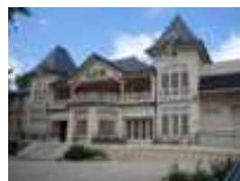
Casino de Santenay