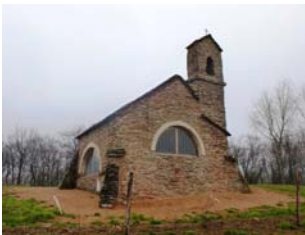
Chapelle de Charcuble :

Il suffit de monter des escaliers; car la table d'orientation se trouve sur les toits de l'Auberge.